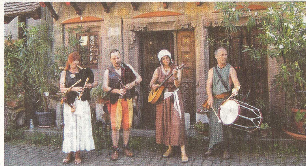
Die Spielleute von „Ridewanz“ unterhalten am Samstagnachmittag.

Das Moderne wird am kommenden Samstag beim Jubiläums-Fest in Mietersheim auch nicht fehlen, denn ab 20 Uhr kann zur Musik der Liveband „Party Sound“ getanzet werden. Der Eintritt hierzu ist frei. Für Speis und Trank ist bestens gesorgt. Dafür sorgt die Vereinigungsgemeinschaft Mietersheim, die die Bewirtung der Gäste übernommen hat.